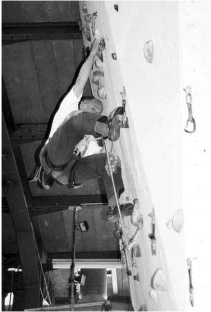
Die Bewältigung von überhängenden Routen ist oft eine Frage der Technik