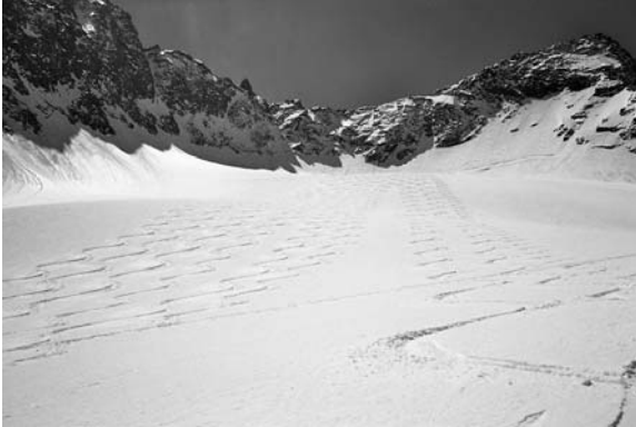
Der Beweis, dass sie da waren...