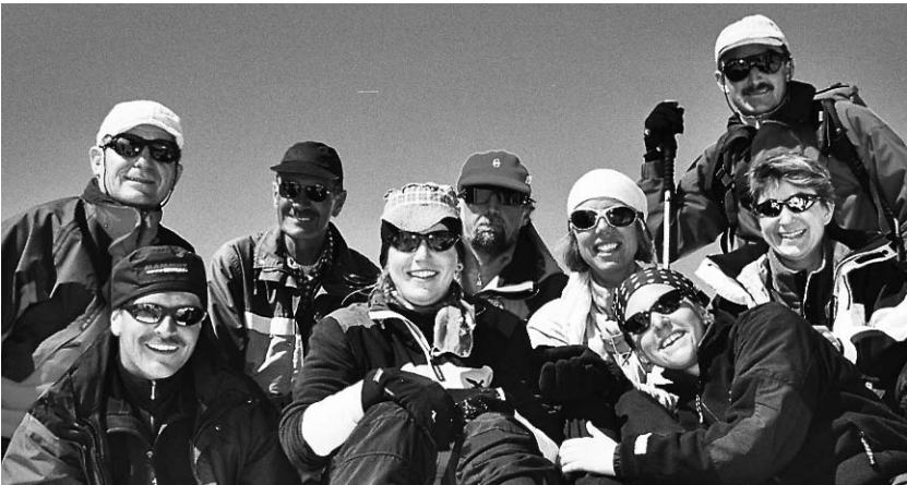
Die Täter an der Oberkräulscharte...