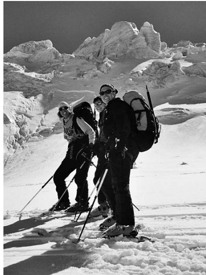
Frauen besprechen die beste Abfahrtstaktik

Mittwoch: Mit Sack und Pack zieht die Gruppe früh los, um die befürchtete, stumpfe Pyramide' oder Schrankogel zu bezwingen. Zwei bleiben am Skidepot um die Skis zu hüten (oder um sich zu bräunen?) und die anderen laufen (oder krabbeln...) auf den Gipfel über einen schönen Grat und üben die Kunst des ‚Pickelpflanzens‘. Es gibt kein Gipfelphoto, da sich die Photographin auf den einzigen flachen Fleck gesetzt hat, ihr Pickel gründlich gepflanzt hat, und sich kein Millimeter bewegen kann. Auf der Wildgratscharte werden dann alle Skis eifrig gewachst bevor die ganze Gruppe in Richtung Franz Senn Hütte zu warmen Duschen runter saust. Dort gibt es Dahu-Filets (die langhaarige, kurzhörnige Sorte) zum Abendessen und viele kühle Radler.