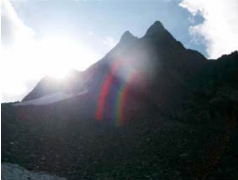
Sonnenaufgang über dem Corn da Camp.

In den frühen Morgenstunden reiste eine SAC - Gruppe von Thusis über Albula- / Bernina-Pass bis Sfazu. Von dort ging's mit dem Postauto nach Saoseo. Bei der Hütte