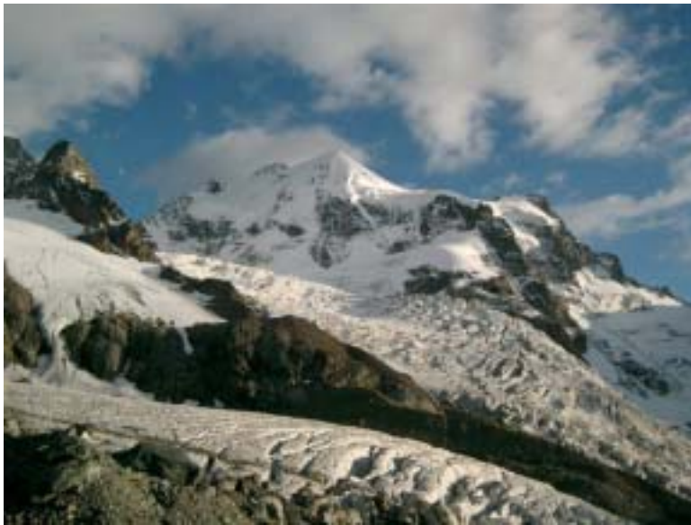
Der Piz Roseg.